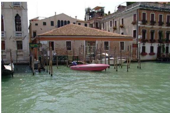
Pavilhão de Portugal . Fondaco dell'Arte . vista exterior

Fondaco dell'Arte Calle del Traghetto o Ca' Garzoni San Marco 3415 Veneza - Itália