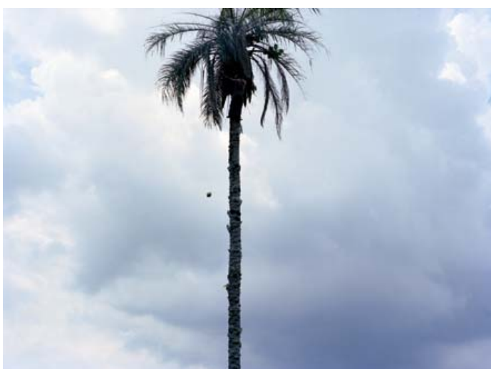
Sobre a gravidade* (About gravity), Fotografia a cores, 95 x 135 cm, 2009

João Maria Gusmão e Pedro Paiva são os artistas que representam Portugal na 53 a Exposição Internacional de Arte - La Biennale di Venezia, que decorre entre 7 de Junho e 22 de Novembro de 2009. A representação oficial portuguesa, organizada e produzida pela Direcção-Geral das Artes do Ministério da Cultura, é comissariada por Natxo Checa.