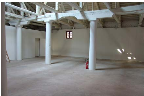
Pavilhão de Portugal . Fondaco dell'Arte . vista interior

Fondaco dell'Arte é um espaço expositivo situado num edifício histórico de Veneza construído no século XVI/XVII e originalmente concebido como armazém / “Fondaco”, como indicia a sua estrutura interior em open space . Tem uma área global de 360 metros quadrados e a remodelação de que foi objecto em 2004/2005 manteve as fachadas de tijolo originais e as características espaciais no seu interior.